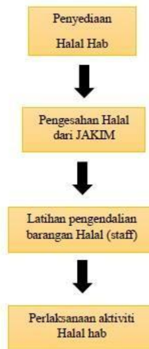
Rajah 2 Proses pelaksanaan Hab Halal di Northport

Syarikat Northport merupakan satu-satunya Pelabuhan di Malaysia yang menyediakan gudang halal bagi barang dagangan yang halal. Menurut responden 1, Northport telah menerima pensijilan halal bagi gudang D4 Northport Districtpark atau NDSB setelah berjaya menjalani audit bagi pengesahan halal di gudang tersebut