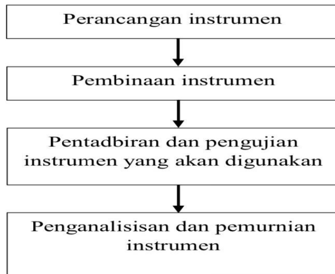
Rajah 2: Carta alir proses-proses menghasilkan instrumen