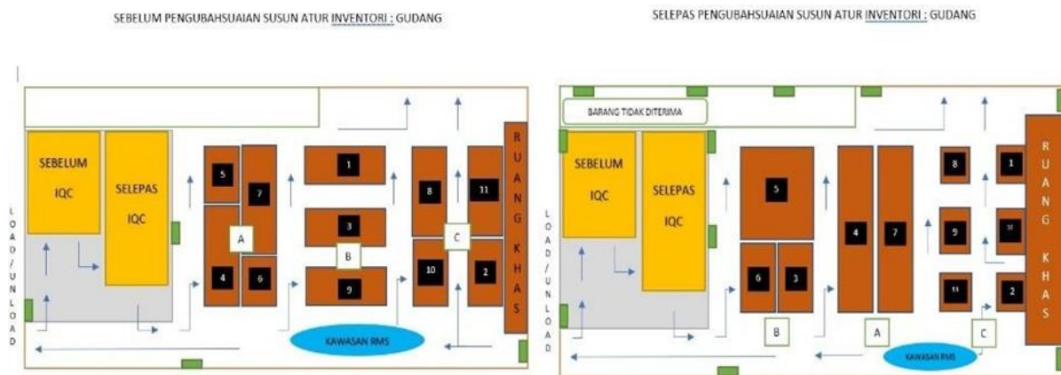
Rajah 2: Susun atur Layout sebelum dan selepas.

Kemudian, campuran peratusan daripada 3 komponen menjadi 12.75% adalah kategori barang kelas B dan akhir sekali, barang kelas C pula adalah 4.2% peratusan nilai kekerapan penggunaan barang. Rajah bar mewakili kawasan bagi komponen-komponen yang telah dikategorikan mengikut kelas di mana bar yang berwarna biru adalah barang kelas A iaitu komponen 4 dan 7, bar berwarna merah adalah barang kelas B iaitu komponen 6, 3 dan 5 manakala bar berwarna hijau adalah barang kelas C iaitu 9, 1, 8, 2, 10 dan 11.