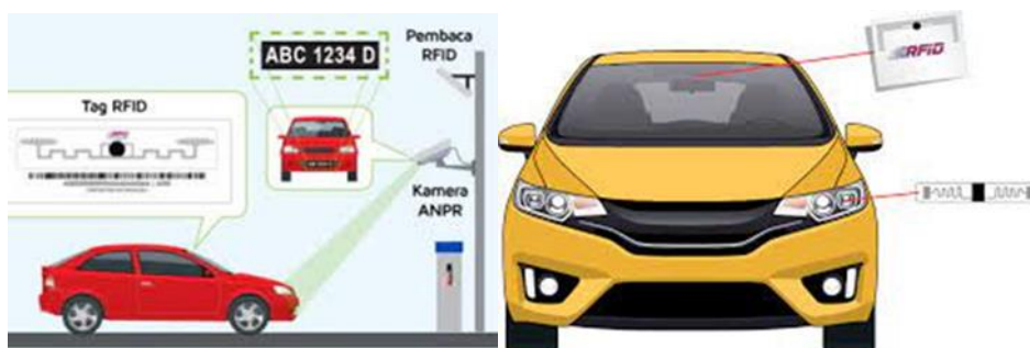
Rajah 1 Sistem MyRFID di Malaysia

Lebuhraya PLUS telah memperkenalkan sistem teknologi baharu iaitu teknologi sistem MyRFID di Malaysia. MyRFID merupakan suatu bentuk transaksi tol yang tidak melibatkan kontak secara langsung demi keselamatan pengguna di jalan raya. Sistem ini diperkenalkan secara berperingkat untuk melihat tahap penerimaan pengguna mengadaptasi diri kepada perubahan teknologi baharu. Hal ini kerana selaras dengan kehendak kerajaan mahu mewujudkan sistem tol Aliran Bebas Pelbagai Lorong (MLFF). Teknologi sistem ini dijalankan adalah untuk mengurangkan kesesakan di atas jalan raya dan bagi mempercepatkan proses transaksi. Menurut Syarikat Lebuhraya PLUS teknologi sistem MyRFID menggunakan sistem ANPR iaitu Sistem Pengesanan Automatik Nombor Pendaftaran (ANPR). Sistem ANPR digunakan untuk mengenalpasti secara automatik dengan menjejaki tag mikro cip yang telah dilampirkan dan dibenamkan di dalam Tag Touch 'N Go RFID .