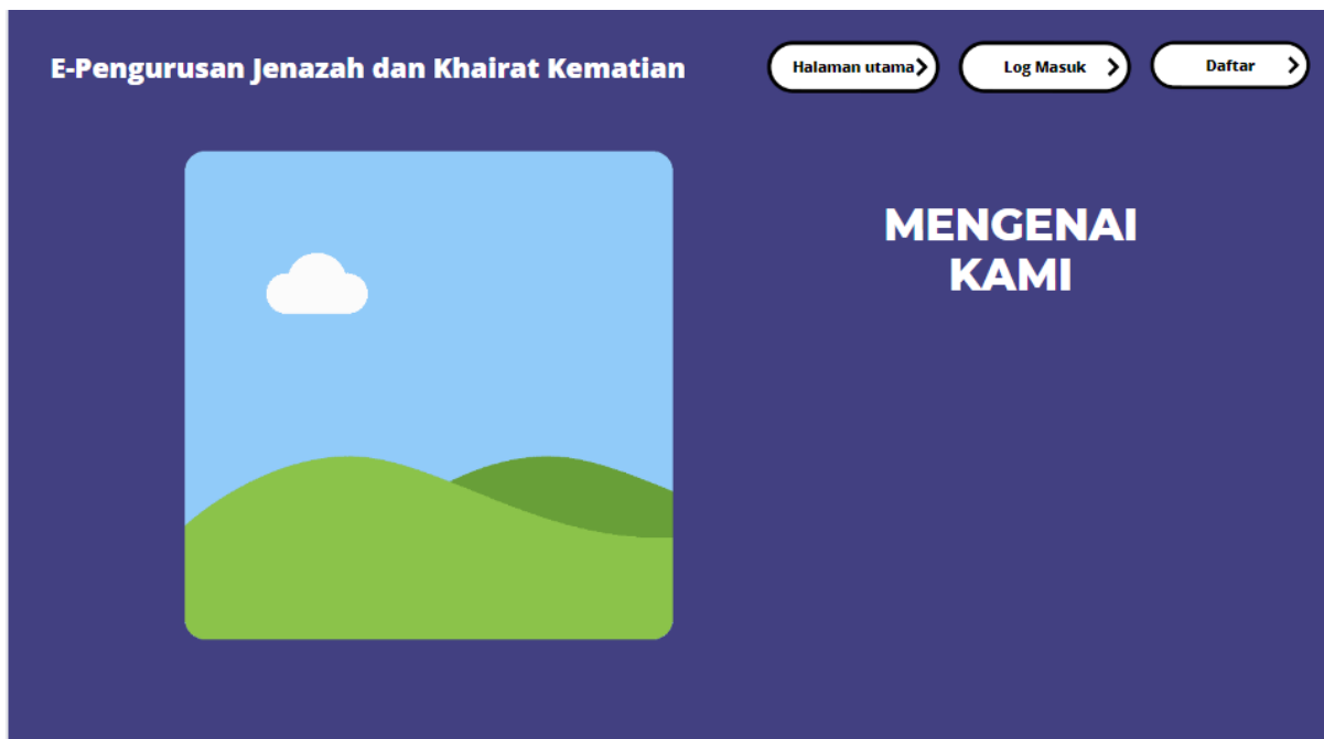
Rajah 2: Lakaran Antaramuka Pengguna

Antaramuka bahagian pengguna yang telah dilakar dengan ringkas dan memudahkan pengguna. Rajah 2 menunjukkan lakaran antaramuka untuk pengguna.