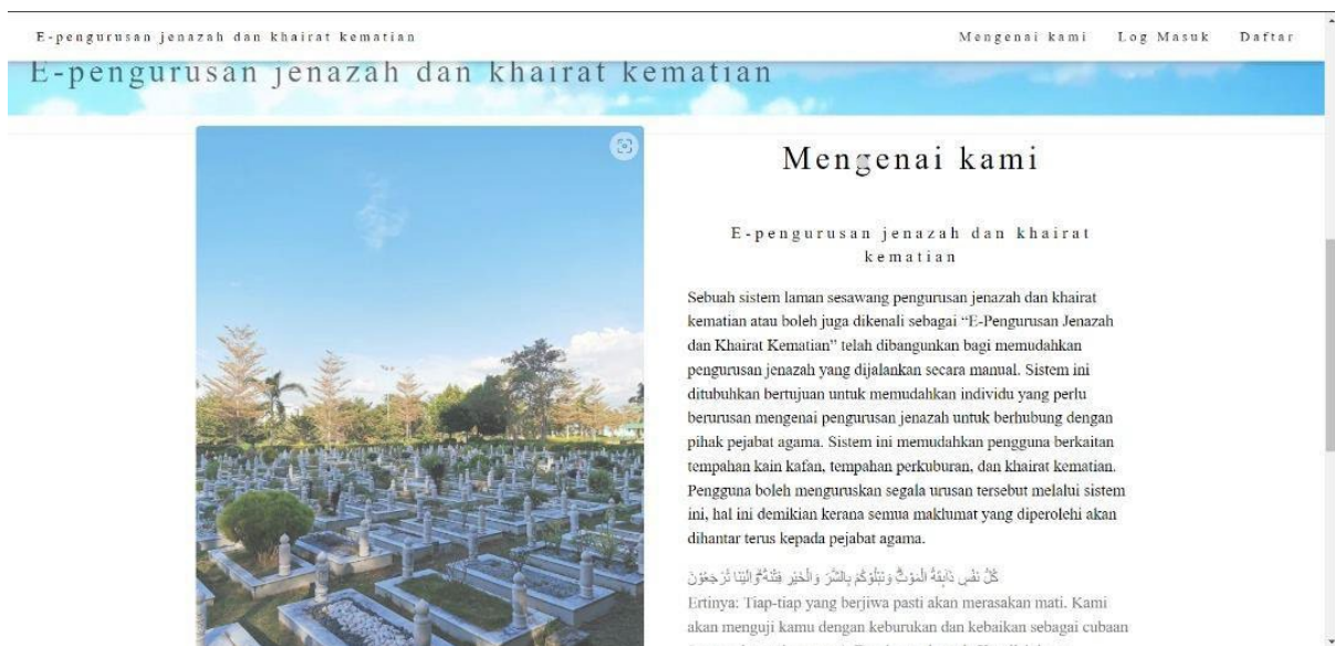
Rajah 4: Antaramuka Pengguna

Seterusnya fasa pembangunan, kami menggunakan Xampp , Mysql , dan Bracket untuk membangunkan sistem ini. Rajah 4 merupakan halaman utama sebelum pengguna melakukan log masuk.