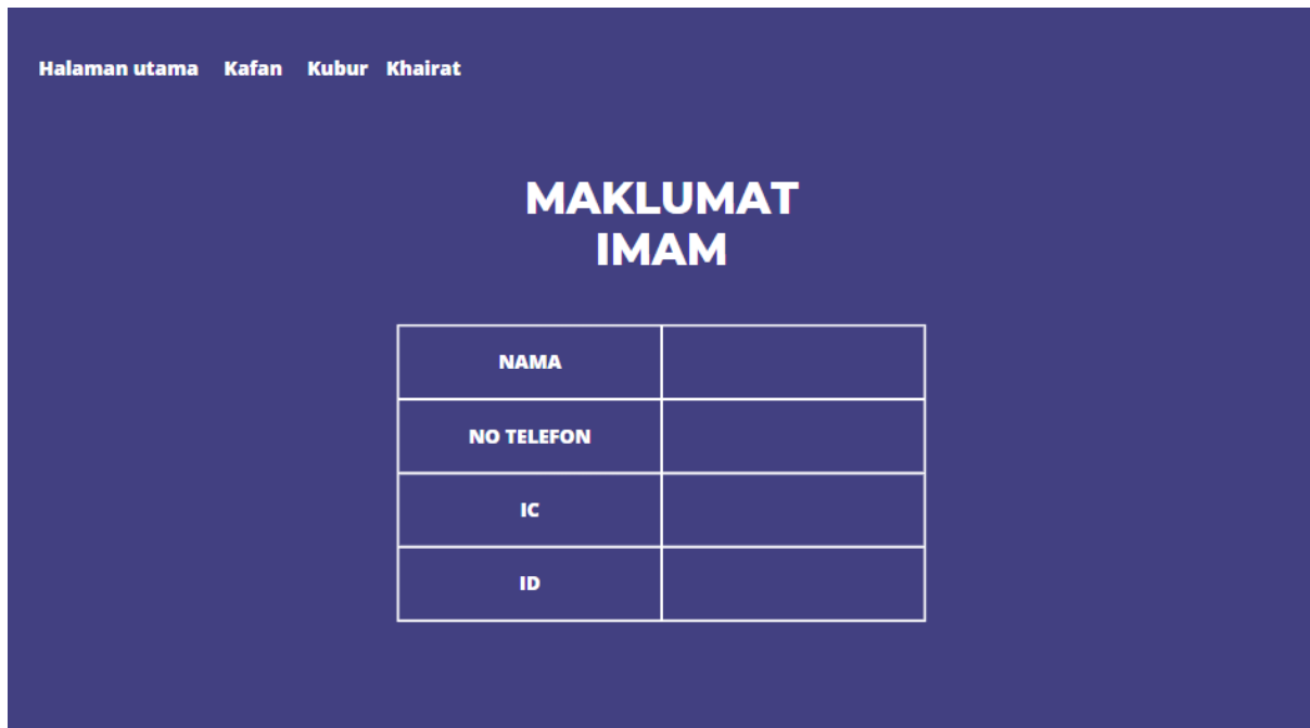
Rajah 3: Lakaran Antaramuka Pejabat Agama

Seterusnya fasa pembangunan, kami menggunakan Xampp , Mysql , dan Bracket untuk membangunkan sistem ini. Rajah 4 merupakan halaman utama sebelum pengguna melakukan log masuk.