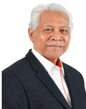
Tan Sri Idris Jusoh Mantan Pengerusi FELDA

Jawatan Pengerusi FELDA yang diamanahkan kepada saya pada Mei 2020, adalah satu tanggungjawab yang besar. Satu amanah untuk mengembalikan kecemerlangan dan kegemilangan FELDA. FELDA adalah sebuah Mutiara Negara. Di tahun 1980-an FELDA berjaya membayar hutang Bank Dunia lebih awal daripada jadual.