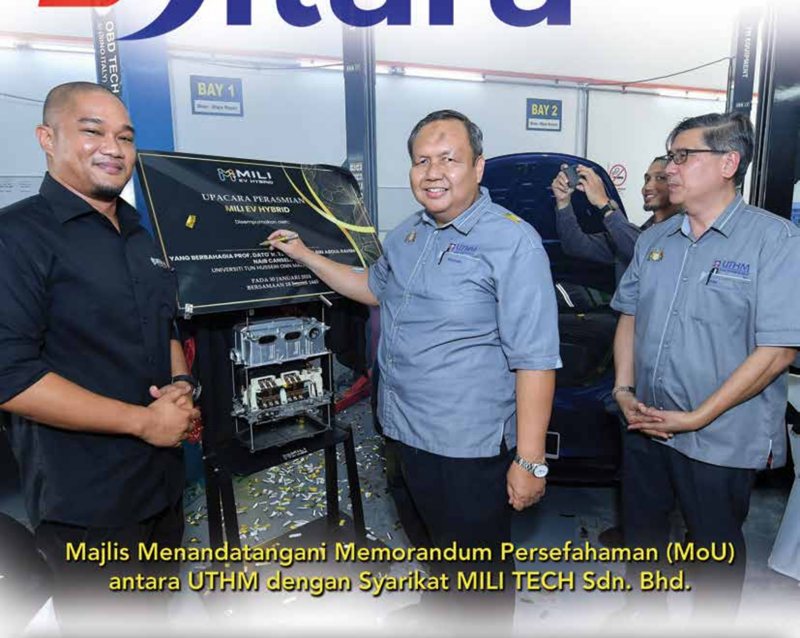
Majlis Menandatangani Memorandum Persefahaman (MoU) antara UTHM dengan Syarikat MILI TECH Sdn. Bhd.