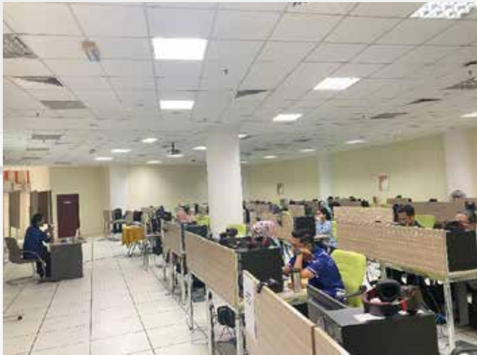
Bengkel Open Journal System (OJS) bagi prosiding dan jurnal baru berkonsepkan kertas ulasan ( review paper ) diadakan di Bilik Komputer (Blok L) Ground Floor, Perpustakaan Tunku Tun Aminah, Universiti Tun Hussein Onn Malaysia (UTHM)