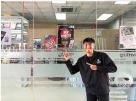
Poster promosi New Semester Sale bulan Mac 2024 di Kedai Buku Penerbit UTHM.