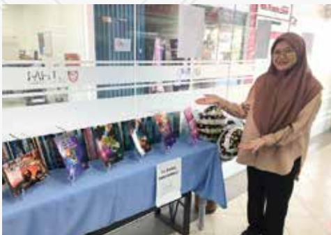
Buku untuk diberikan secara percuma kepada pelanggan yang sudah mengikuti Penerbit UTHM di aplikasi TikTok.

Bukan itu sahaja, Unit Promosi dan Pemasaran turut menjalankan pemberian buku secara percuma kepada semua pelanggan yang hadir ke Kedai Buku Penerbit UTHM yang telah mengikuti media rasmi Penerbit UTHM di aplikasi TikTok.