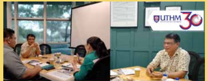
ICC CONNECTS: VIOSIMOS GREEN SOLUTIONS SDN BHD / GREEN PRODUCT / 07 JANUARY 2024

Objektif pertemuan ini adalah tertumpu kepada perbincangan kerjasama, halatuju dan potensi pengkomersialan bersama syarikat tersebut.