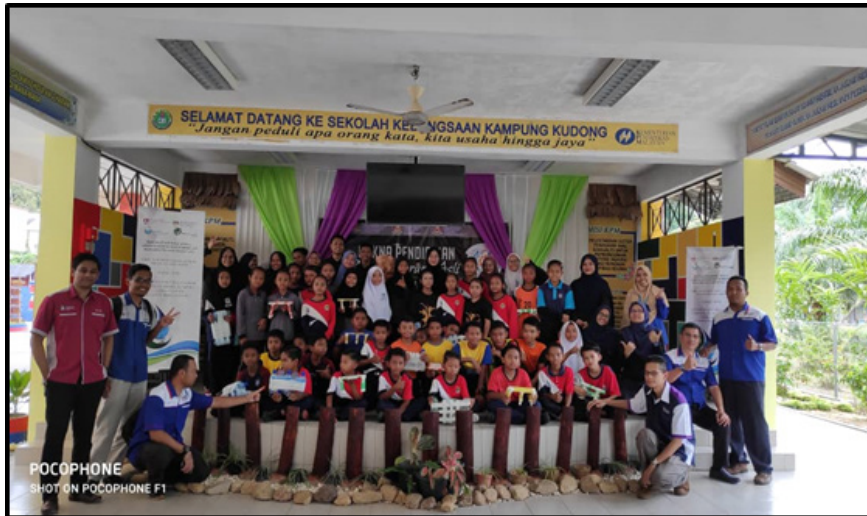
Rajah 5.8: Penyelidik UiTM Kampus Pasir Gudang bersama murid-murid Orang Asli di SK Kampung Kudung