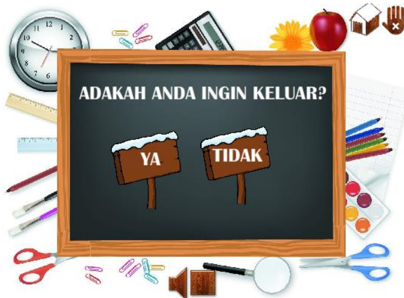
Rajah 5 - Paparan keluar koswer

Selain itu, paparan keluar terdapat dua (2) butang iaitu butang ya untuk keluar daripada koswer dan butang tidak untuk kembali ke dalam koswer. Rajah 5 menunjukkan paparan keluar koswer