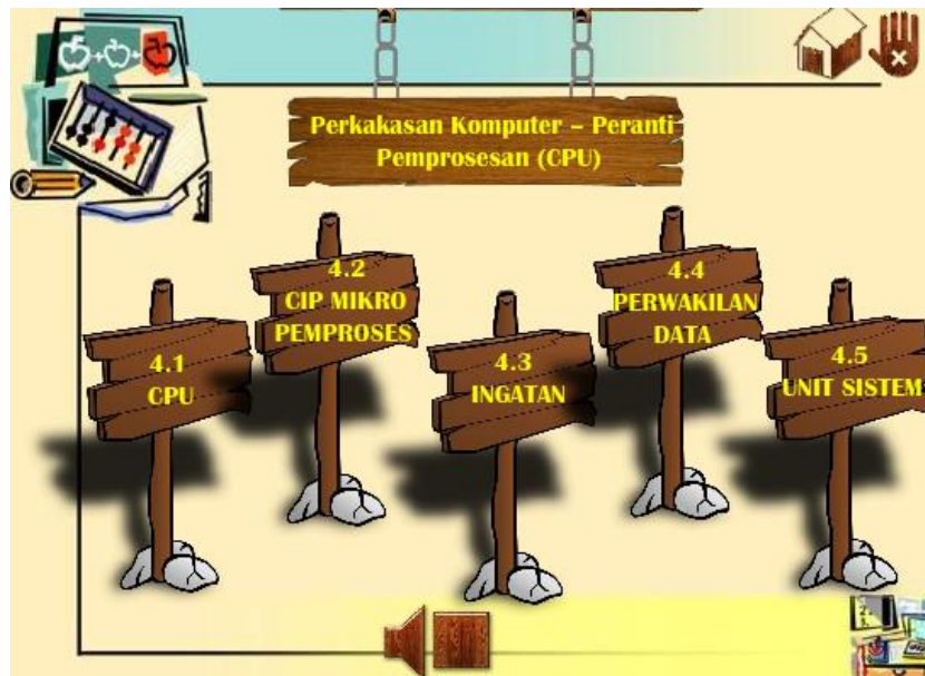
Rajah 3 - Paparan menu utama koswer

Rajah 3 memaparkan paparan menu utama koswer. Pada paparan ini, terdapat 5 sub topik utama iaitu CPU, Cip Mikro Pemprosesan, Ingatan, Perwakilan Data, dan Unit Sistem. Selain itu juga, terdapat butang home untuk pergi ke paparan montaj, butang keluar untuk keluar pada koswer ini dan juga butang sound untuk mula dan berhenti muzik latar belakang.