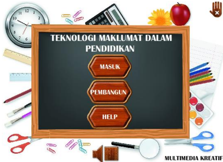
Rajah 2 - Paparan montaj koswer

Rajah 3 memaparkan paparan menu utama koswer. Pada paparan ini, terdapat 5 sub topik utama iaitu CPU, Cip Mikro Pemprosesan, Ingatan, Perwakilan Data, dan Unit Sistem. Selain itu juga, terdapat butang home untuk pergi ke paparan montaj, butang keluar untuk keluar pada koswer ini dan juga butang sound untuk mula dan berhenti muzik latar belakang.