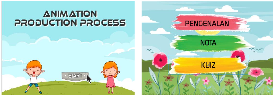
Rajah 3: Reka bentuk informasi dalam koswer pembelajaran

Seterusnya, Rajah 4 pula menunjukkan reka bentuk antaramuka bagi pembangunan koswer pembelajaran yang dihasilkan menggunakan Adobe Flash CS6. Reka bentuk antaramuka yang dihasilkan menggunakan prinsip-prinsip pengarang multimedia iaitu konsistensi, kejelasan dan fleksibiliti. Ini kerana melalui reka bentuk antaramuka ini, pengguna boleh memahami susun atur kandungan pembelajaran seperti kuiz yang dijalankan menggunakan koswer pembelajaran tersebut seperti soalan betul atau salah yang mengikut pilihan jawapan masing-masing. Selain itu, prinsip fleksibiliti membolehkan pengguna untuk menutup kover pembelajaran pada bila-bila masa mengikut kesesuaian masa yang diperlukan.