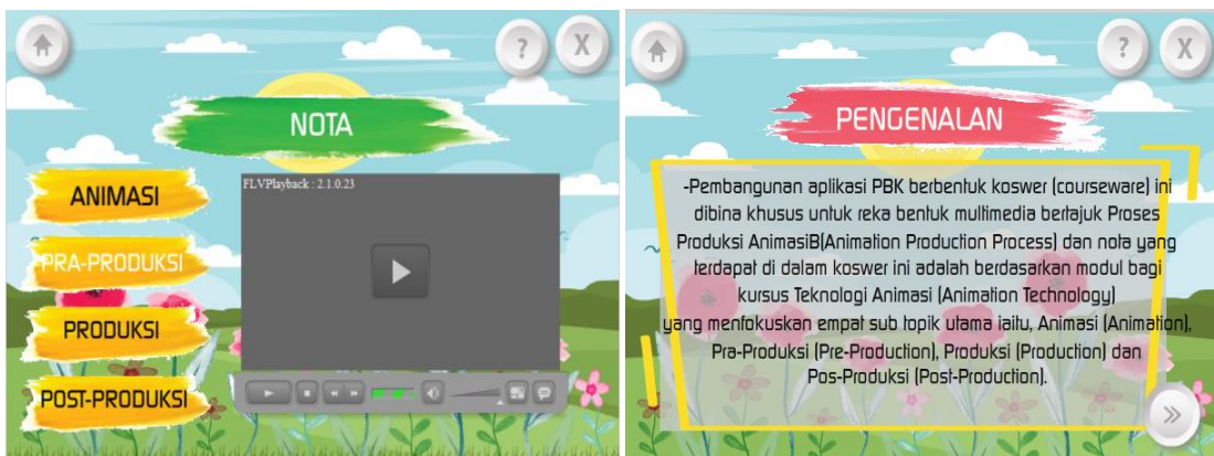
Rajah 2: Reka bentuk informasi dalam koswer pembelajaran

Dapatan kajian ini adalah apakah reka bentuk informasi, interaksi dan antaramuka bagi pembangunan koswer pembelajaran berbantuan komputer untuk topik penerbitan animasi. Bagi reka bentuk informasi, pembangun telah membangunkan reka bentuk informasi yang terdiri daripada empat topik iaitu animasi, proses pra produksi, proses produksi dan proses pro produksi dalam penerbitan animasi seperti rajah 2.