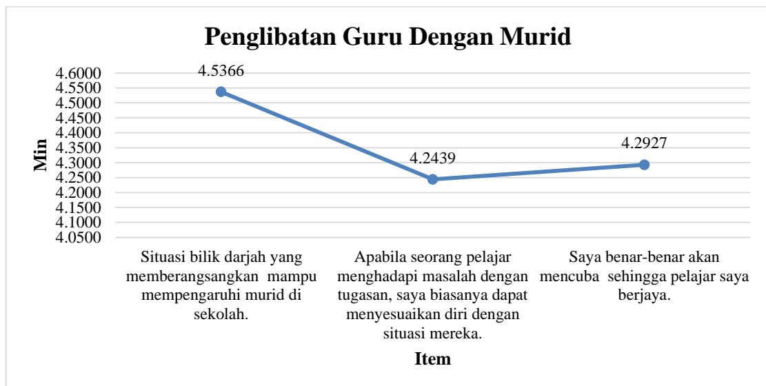
Graf 2: Penglibatan Guru Dengan Murid

Graf 1 menunjukkan taburan min bagi aspek pengurusan guru dalam bilik darjah. Dapatan menunjukkan min tertinggi adalah “ Saya menekankan kepada perkara yang positif apabila bersama-sama murid ” (min=4.43). Min terendah adalah “ Saya sentiasa adil dan konsisten dengan murid saya ” (min=4.14). Min keseluruhan bagi pengurusan guru dalam bilik darjah ialah 4.14 dan sisihan piawai 0.52.