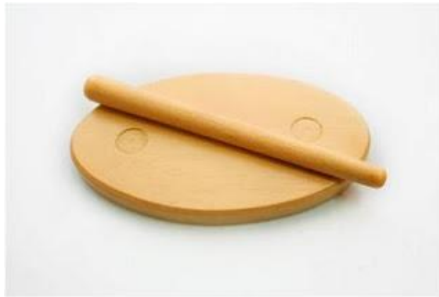
Rajah 3 - Alat ketuk Al-Baghdadi (papan ketuk dan kayu ketuk)

( Multiple Intelligence ) yang diperkenalkan oleh Howard Gardner dalam pendidikan awal kanak-kanak. Alat Ketuk ini boleh dilihat pada Rajah 3 .