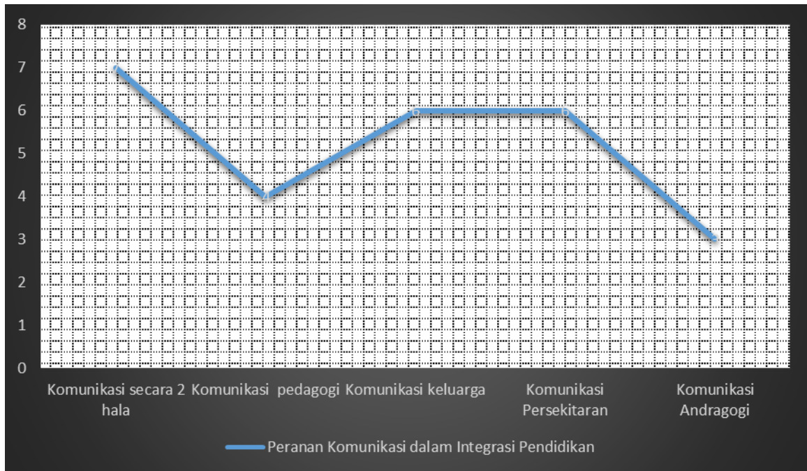
Rajah 2 : Gambaran Analisis Peranan Komunikasi dalam Membentuk Integrasi Pendidikan