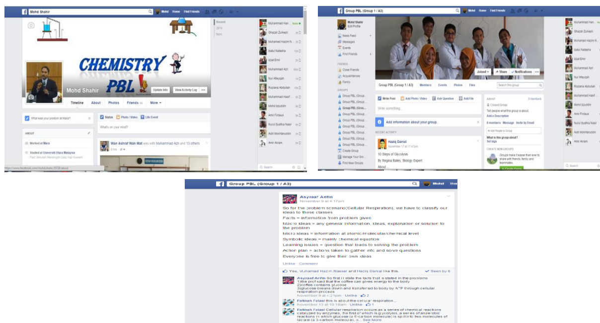
Gambar rajah 1.0: Contoh Paparan Muka Hadapan Salah Satu Kumpulan PBL Berserta Perbincangan.